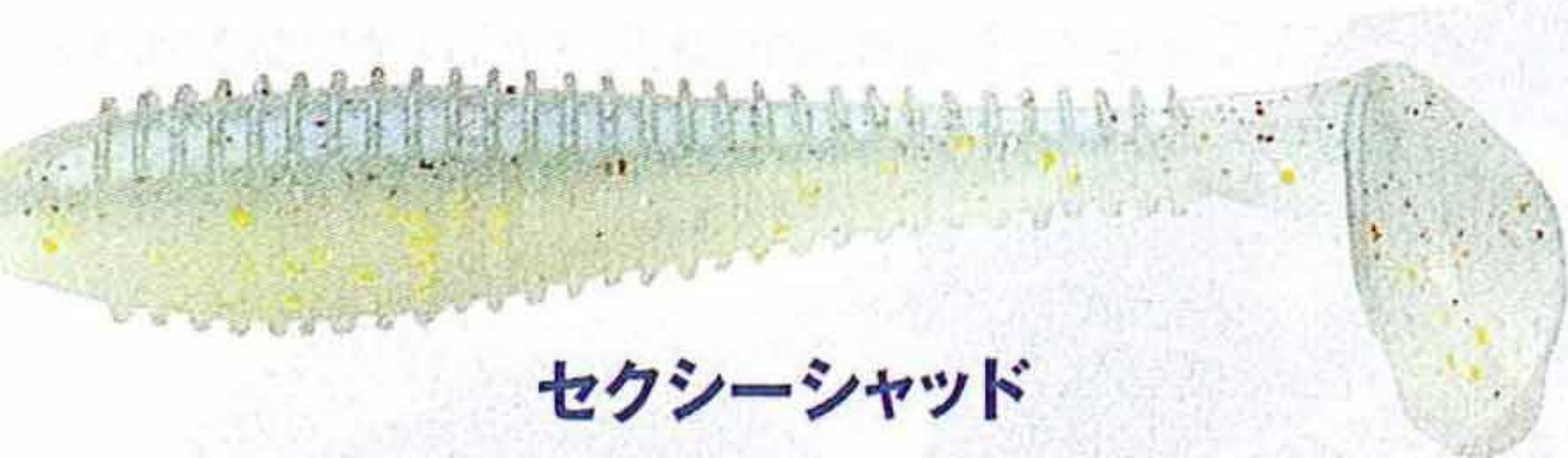
セクシーシャッド