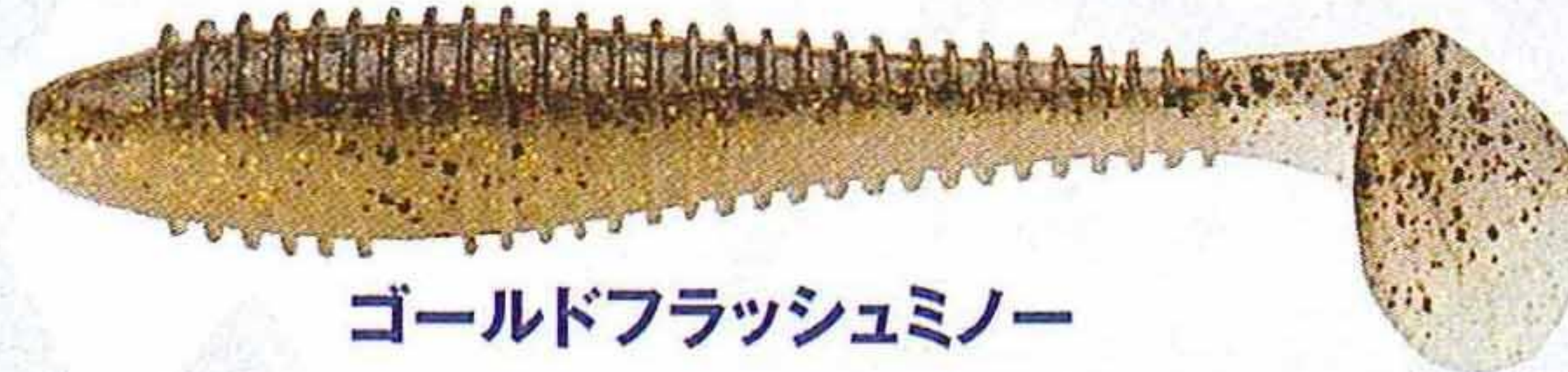
ゴールドフラッシュミノ