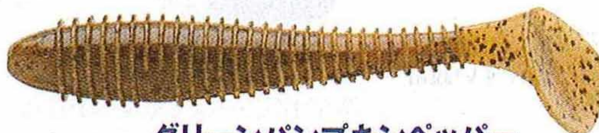
グリーンパンプキンペッパー